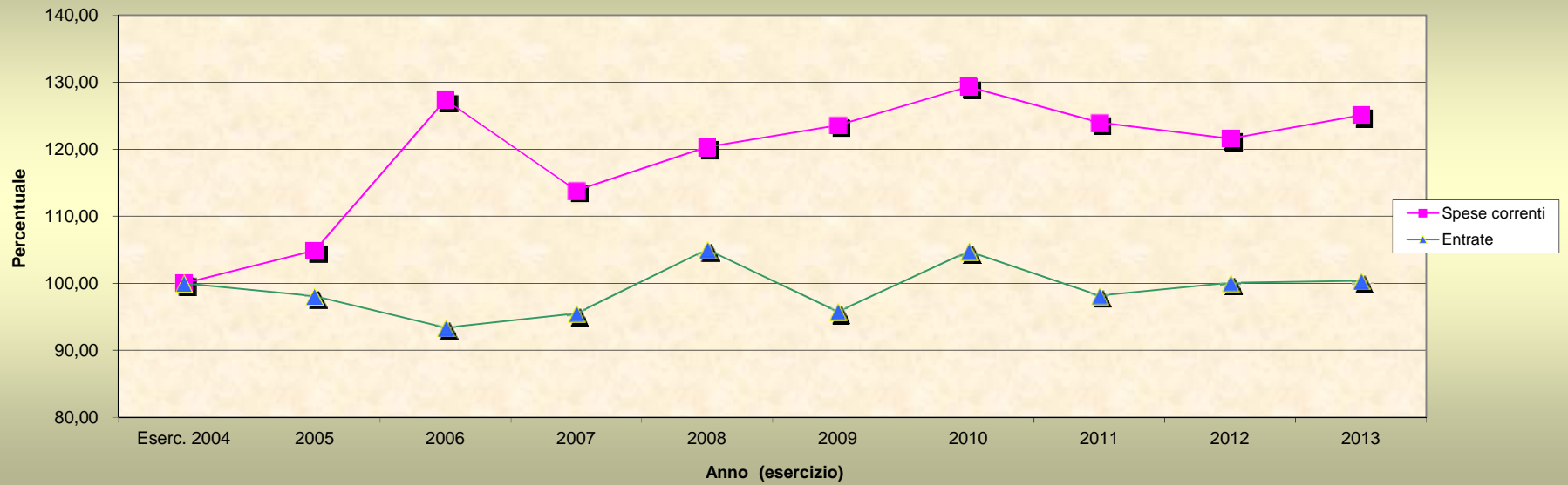
Equilibri (entrate correnti - spese correnti) trend dal 2004 (accertamenti di entrate, tit. I + tit. II + tit. III, ed impegni di spesa, titolo 1 + quota capitale amm. mut rilevati nella sola gestione di competenza e desunti dai risultati dei rendiconti)